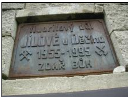
Vstupní deska do fluoritového dolu