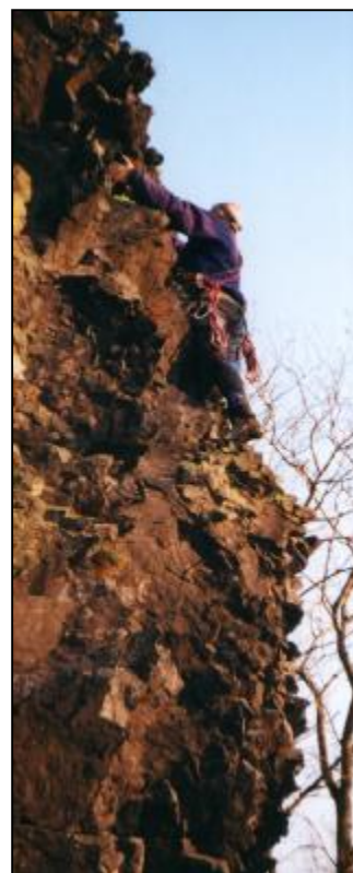
(Autor v cestě Lego na Wesselsteinu)

(Možná si vzpomínáte, že podrobnosti o těchto oblastech včetně nákrešů a cest jsme zveřejnili na stránkách CAO News v loňském roce.)