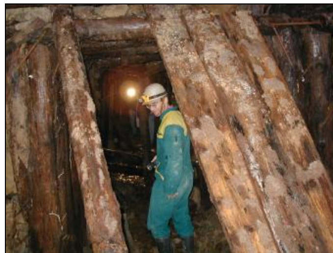
V jedné z bočních štol

Při prolézání již několikátého (neúplného) závalu zjišťuji, že mé nadšení z objevování nových podzemních prostor postupně ochabuje a v místech, kdy mě přestává svítit čelovka a ostatní zůstávají daleko přede mnou, nadšení ztrácím úplně. Naštěstí včas oživuji pohaslé světlo a zrychleným pochodem v blátě a kličkováním v loužích, doháním naši skupinu. Shodou okolností se na toto téma zavádí náš hovor. Kdo, kdy a kde v podzemí zabloudiv nebo zůstal beze světla. Cestou zpět, ke křižovatce podzemních chodeb, následuje několik více či méně hrůzostrašných historek, kupodivu vždy s dobrým koncem. To se již ocitáme v hlavní přístupové štolě.