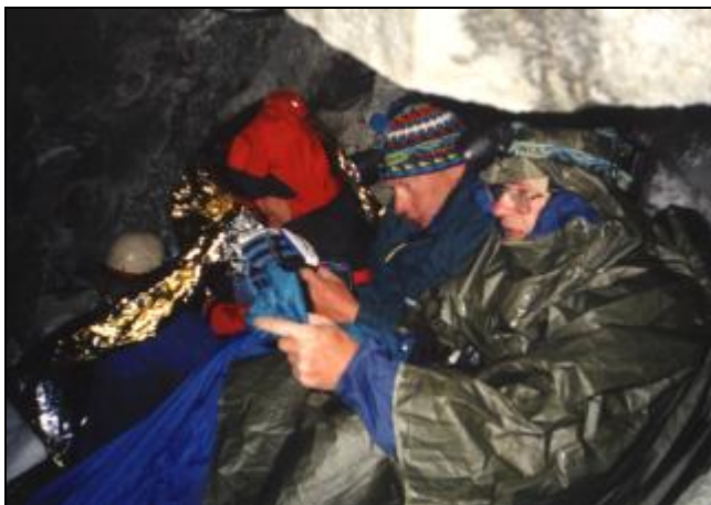
Bivak, Matterhorn, asi 3750 m n.m.

Jó, na úpatí, to jsou jiné pocity! Sundáš blembák z upocených vlasů, vyskrkneš jedním lokem plechovku piva, kamarádům potřešeš rukou se slovy „Dole zdar!“ a teď teprve tě začne polévat kýžená vlna spokojenosti.