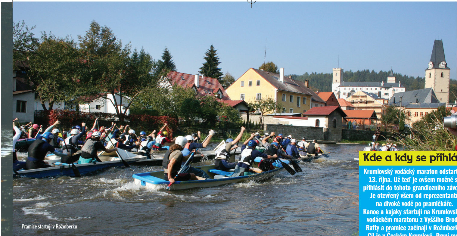
Pramice startují v Rožmberku