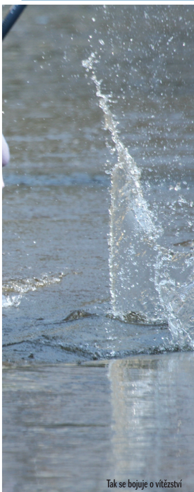
Tak se bojuje o vítězství