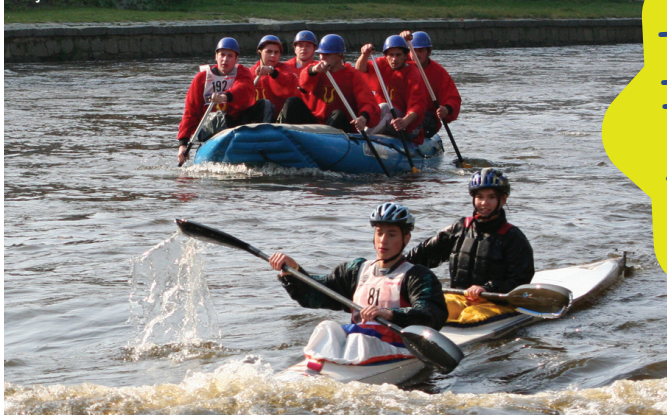
Kajak na hladkou vodu se ztrácí ve vlně

mít o deset kilometrů blíž než ti, kteří startují z Vyšáku. Ve Vltavě poteče přes dvacet vteřinových kubíků vody, takže v cíli v Českém Krumlově budete natatata. Pak už zbývá jenom sešplouchnout jez se superlativním válečkem u Jelení lávky, obeplout ostrůvek a poprat se s protiproudem do cíle. A to je celé. Teda skoro. To nejlepší na konec. Kvalitní ceny předáme nejlepšímu, vyhlášíme první tři v každé vypsane kategorii. No a hlavně tady Vám uvařím toho svařáka. ■