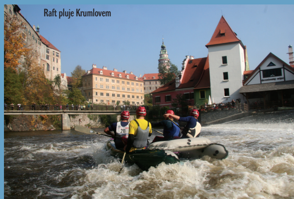
Raft pluje Krumlovem