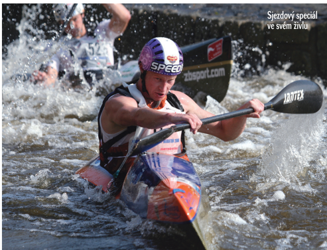
Sjezdový speciál ve svém živlu