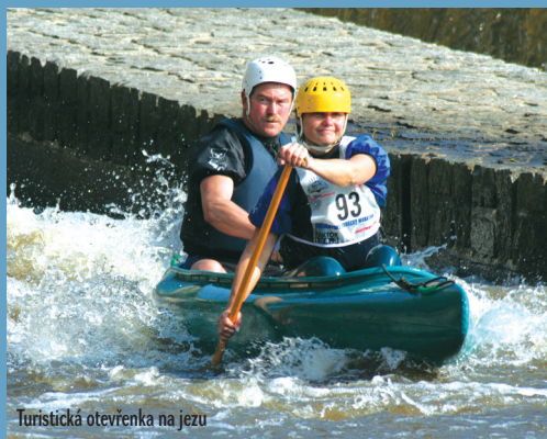
Turistická otevřenka na jezu

Horydoly jsou mediálním partnerem Krumlovského vodáckého maratonu.