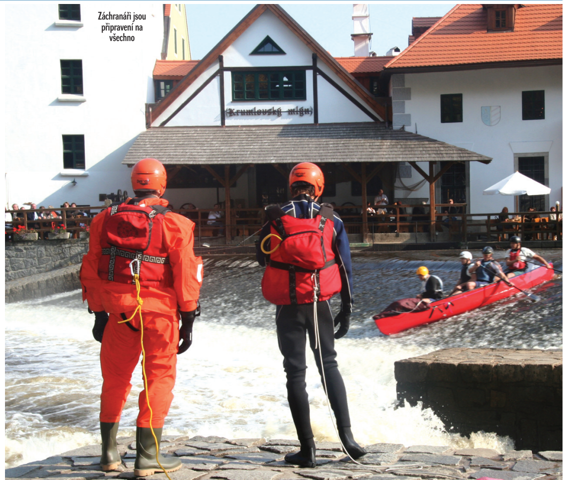
Záchranáři jsou připraveni na všechno