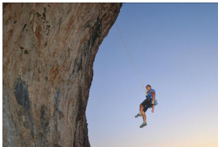
Jířa v mírně převislé cestě

taxíku, bez nehody jsme dorazili do „studia“ Panormitis.