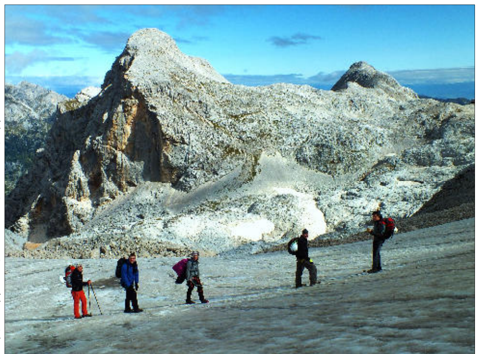
Přechod ledových ker

Začali jsme se balit, snídat a připravovat na výstup na Triglav. Rozhodli jsme se dojít do Triglavského domu (2515 mnm) a podle času zvážít ještě ten den výstup na samotný vrchol, který má 2864 mnm. Nebo na chatě zůstat do dru-