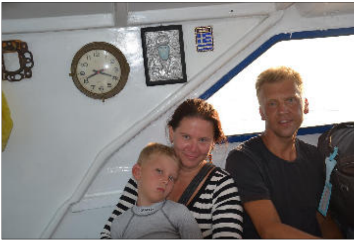
Náhrada za trajekt