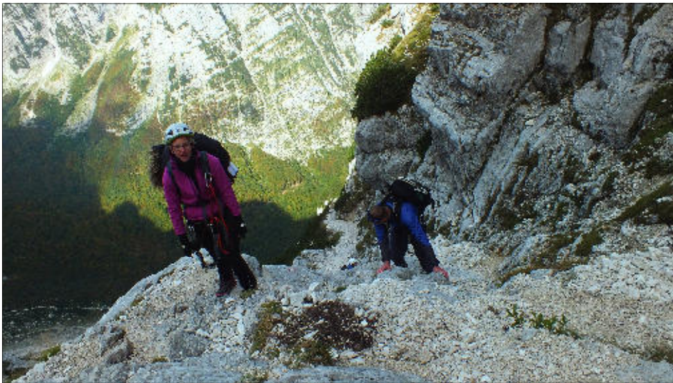
Nezajištěná část k domu

nejen kvůli únavě, ale také se opravoval slovinský hraniční tunel, kde nás nechali skoro dvě hodiny čekat v koloně. Ještě že jsem s sebou měla v autě několik alb Foo Fighters, jejich pecky byly skvělým společníkem a prevencí proti mikrosnánku v době, kdy celá osádka auta spala.