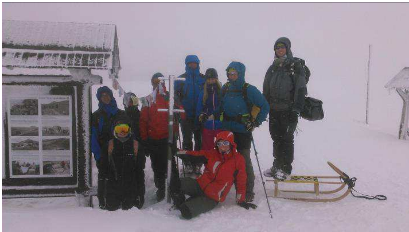
Turistika na polské hranici

nemělo. Novinkou letošního roku totiž byl plánovaný výlet na východ slunce na Sněžce. Blahouš byl demokraticky vybrán vedoucím výletu a bylo i docela dost zájemců, ale počasí neporučíš. Neděle nám připravila nárazový vítr, nízkou oblačnost a drobné sněžení.