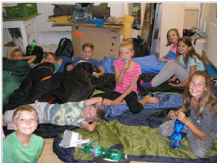
Kemp Malá Skála - celá parta