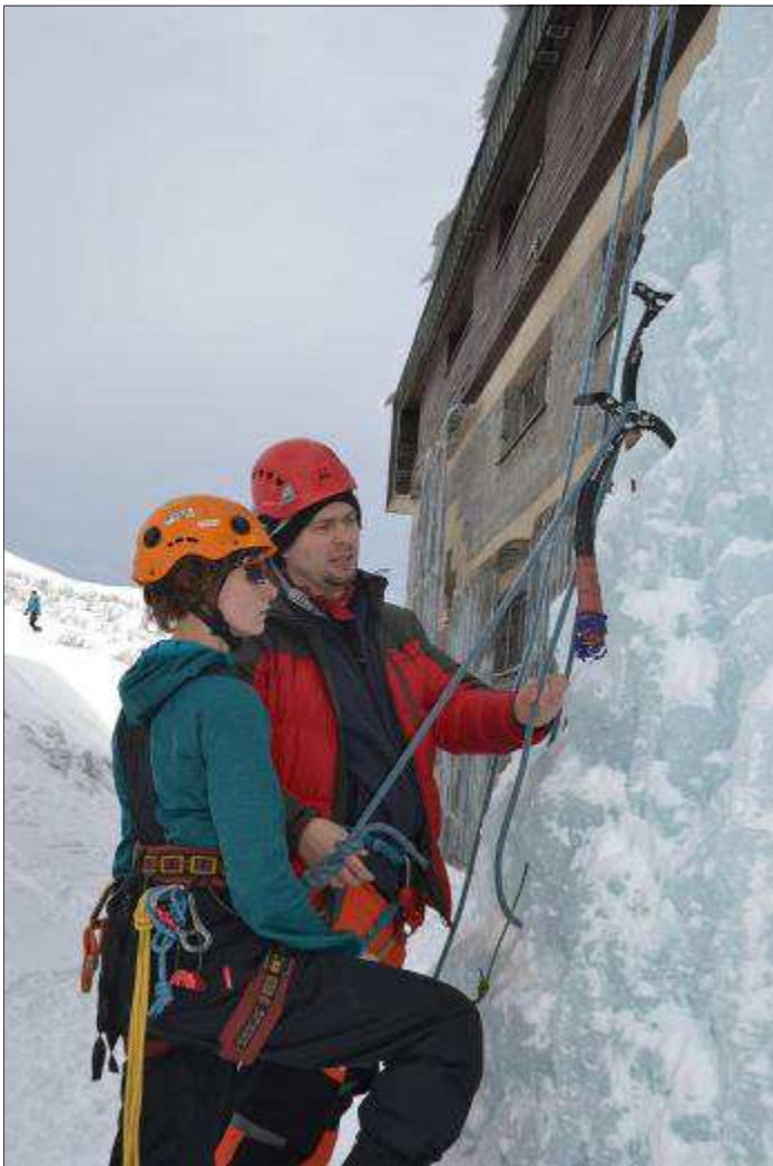
Jak na ledopád ...