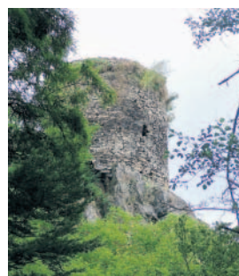
Pod Zbořeným Kostelcem je tábořiště.

Přesto je v kraji stále několik původních tábořišť, kam by se ne-