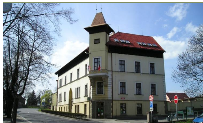
Budova radnice ve Slatiňanech