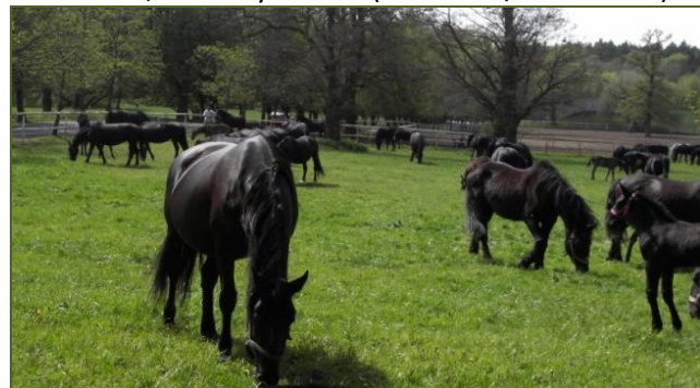
Kladrubští vraníci ve výběhu pod kaštankou

chovu koní, středisko rostlinné výroby a středisko údržby. Správní středisko se nachází v hlavní budově hřebčína. Středisko Ústřední evidence chovu koní patří pod Českomoravskou společnost chovatelů a.s. a je pověřeno MZe ČR vedením ústřední evidence všech koní, chovaných v ČR (mimo A 1/1 a klusáka).