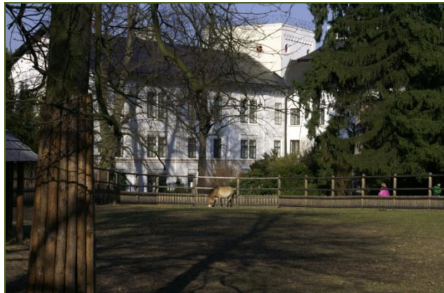
Výběh pro koně Přewalského v zámeckém parku

První písemné informace o původní tvrzi pocházejí z konce 13. století, když ji v roce 1294 vlastnil František ze Slatiňan. Od té doby do poloviny 18. stol. se na tvrzi a od konce 16. stol. na zámku, vystřídal více než 30 majitelů. Bylo až neuvěřitelné, v jak krátkých časových intervalech se vlastníci panství střídali a jaké je postihovaly osudy – od zchudnutí, přes konfiskace, po náhlá a příliš časná úmrtí.