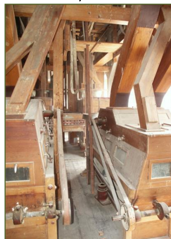
Interiér mlýna, reformy na čištění krupic

Ve mlýně Skály docházelo postupně k modernizaci. Na přelomu 20. století bylo osazeno vodní dílo turbínou girardotovou - spirála a následně pak v roce 1909 po větší rekonstrukci vodního díla turbínou francisovou, která po rekonstrukci v roce 1992 pracuje dodnes. Využívá průtoku vody cca 1200 l/s, se spádem 4,20 m a výkonem do 25 kW. Mlýn, který byl v majetku rodiny Fouskovy na přelomu 20. století, dostal své současné architektonické podoby roku 1934. Vlastní rekonstrukce technologického zařízení mlýna byla provedena v roce 1948 tak, že mlýn byl schopen mlet obchodní mletí - pšenici nebo žito ve výši 25 tun za 24 hodin. Mlýn byl poháněn vodní turbínou a jednotlivé stroje klasickým rozvodem pomocí transmisí a kožených řemenů jak tehdy bylo zvykem. Na mlýn však byla roku 1950 uvalena národní správa a v roce 1954 byl mlýn i veškerý ostatní majetek znárodněn.