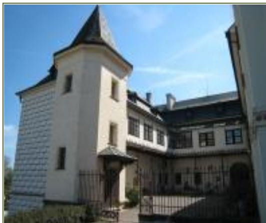
Státní zámek ve Slatiňanech, nádvoří

Zámecký areál ve Slatiňanech je skutečným a neobjeveným rájem pro návštěvníky, kteří hledají odpočinek, kulturní a zároveň sportovní vyžití. Kde jinde máte na několika hektarech zámek, hřebčín, rozlehlý anglický park, rekreační lesy s množstvím sportovišť, oboru s jeleny a muflony, třešňovou alej a nedaleko též alej jedlých kaštanů.