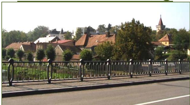
Pohled na slatiňanský zámek a kostel