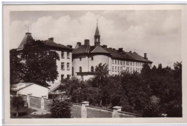
Pohlednice kláštera z 50. let minulého století

Slatiňanský klášter, který se skládá ze dvou budov a nové přístavby, se nachází v centru Slatiňan. První klášterní budova byla postavena v roce 1882 z iniciativy školských sester řádu sv. Františka a sloužila jako opatrovna a mateřská škola. Druhá budova, v níž byla zřízena dívčí měšťanská škola, byla dokončena v roce 1905. Za 1. světové války sloužil klášter jako lazaret pro zraněné vojáky. Od roku 1926 je domovem mentálně postižených dětí, kterých nyní v Ústavu sociální péče žije asi 300.