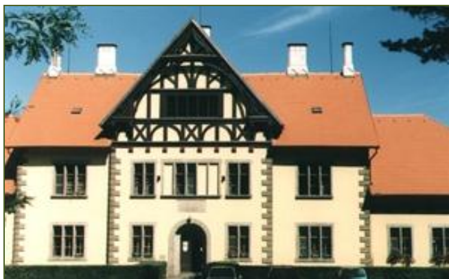
Hlavní budova státního hřebčína

Hřebčín Slatiňany je od r. 1992 součástí Národního hřebčína Kladruby nad Labem, s.p.o. Nachází se ve východních Čechách u města Chrudim, nedaleko Pardubic. Hřebčín Slatiňany má správní středisko, středisko Ústřední evidence chovu koní, 4 střediska