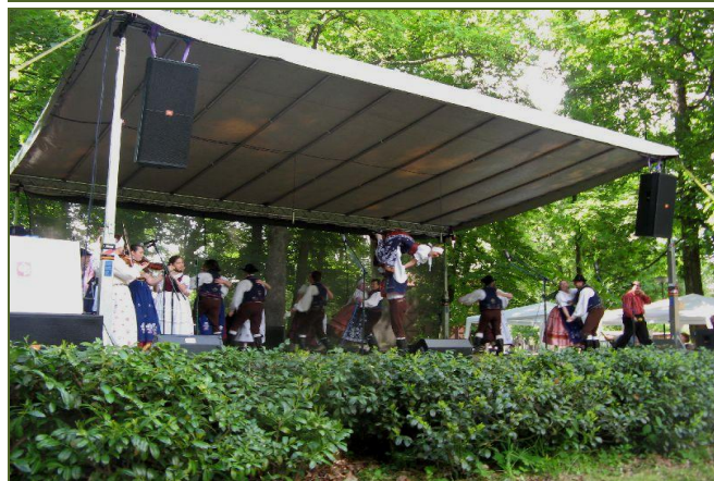
„ Slatiňanské pozastavení“ - fotografie z roku 2010