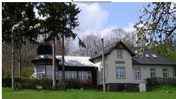
Lesní, výletní restaurace Monaco – občerstvovací