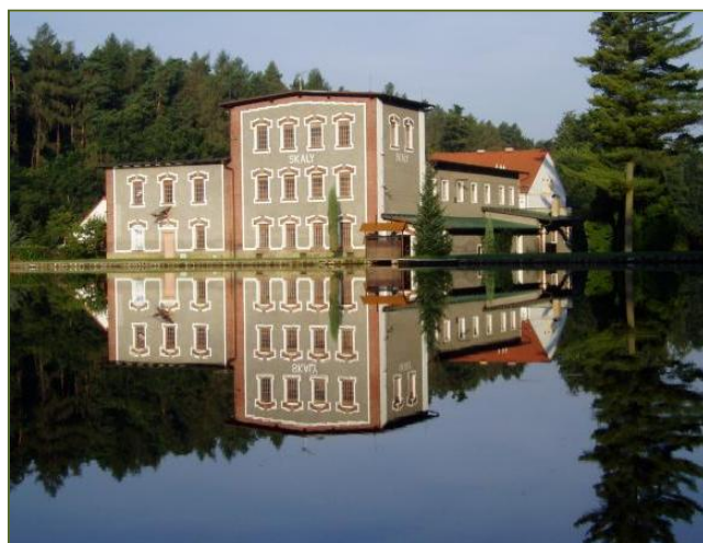
Malebná stavba Mlýn Skály v údolí řeky Chrudimky nedaleko Slatiňan na Chrudimsku.

Z historických pramenů je známo, že mlýn v uvedené lokalitě byl již v 16. století a již tehdy využíval k pohonu vodní síly, která poháněla čtyři mlýnská kola na vrchní vodu. V této době to byl poměrně velký mlýn. Postupem času se však i mlynářské řemeslo přenášelo do větších lokalit, takže vznikly větší mlýny např. Janderov u Chrudimi a mlýn Winternicův v Pardubicích.