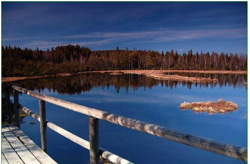
Cirrusy vysoko na nebi předpovídali objednané skvělé počasí na celý týden.

P-S. Krásná 16km dlouhá trasa pro kolaře nebo bruslaře vede na pěkné uzavřené asfaltové silnici ze Stožce do Pece.