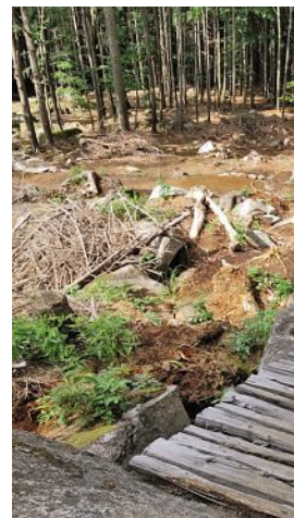
Bikovou trasu nejdete třeba i v Hřensku (nahore). Oblíbené jsou i Rychlebské stezky (uprostřed) nebo bikepark v Kopřivné (dole).